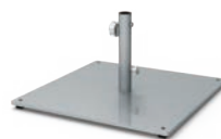
SOCLE CARRÉ, INSTALLATION EN SURFACE