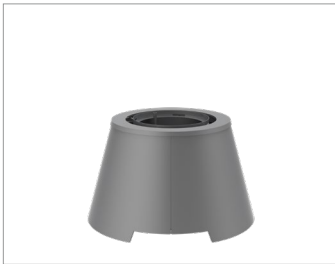
CONTRARIO - Mini

Toutes les bacs à fleurs sont dotées d'ouvertures de drainage intégrées et acceptent les systèmes d'irrigation.