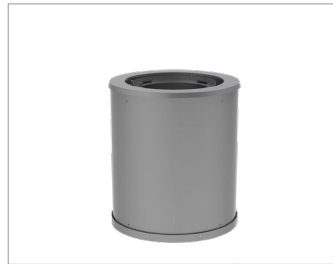
STANDARD - Mini

63 3/4 po larg. x 48 3/8 po haut. Montage en surface