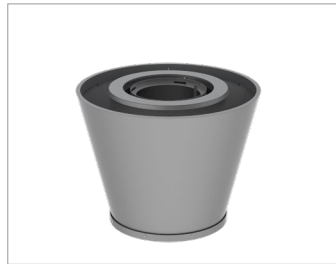
OLYMPUS - Mini

59 3/8 po larg. x 36 1/8 po haut. Autoportante