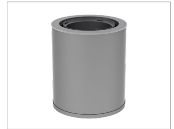
STANDARD - Grand

41 3/4 po larg. x 46 1/8 po haut. Montage en surface